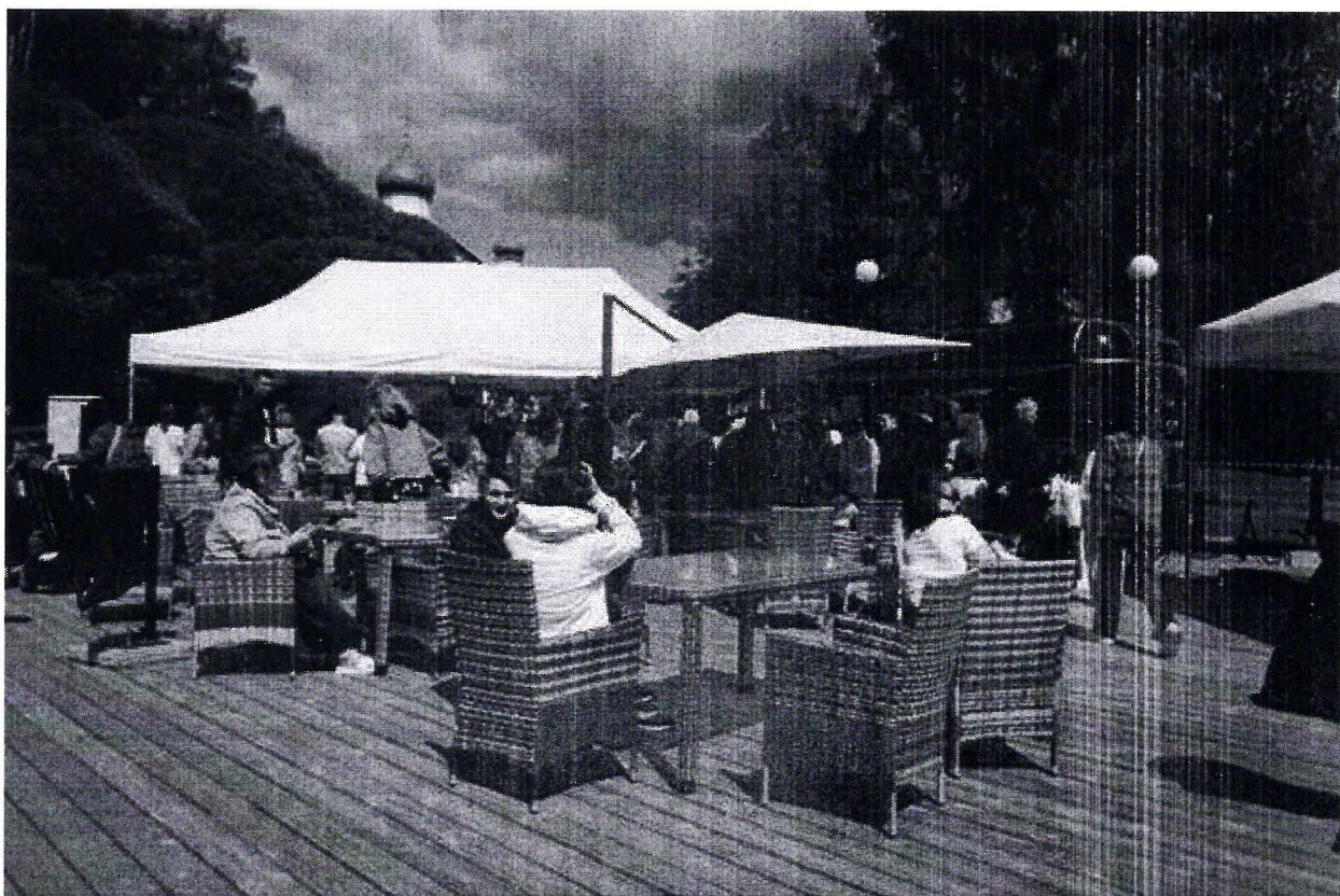
Пример оформления зоны общественного питания

Одежда у работников зоны должна соответствовать общей стилистике мероприятия.